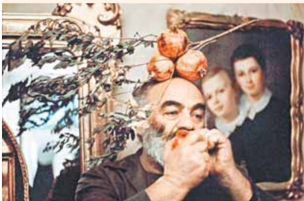
Фото с Параджановым

К 100-летию знаменитого армянского режиссера Сергея Параджанова в Санкт-Петербурге открылась выставка фотографий, посвященная жизни и работе мэтра.