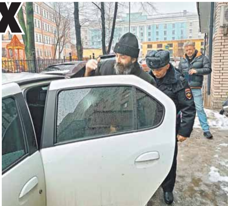
После недавнего ареста архиепископу стало плохо

— Нет, со стороны государства мы не получаем никакого противодействия. АПЦ зарегистрирована в Минюсте, сдает отчетность, создает новые орга-