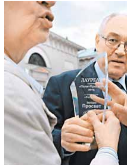
2014 г. Вручение премии

– Если честно, у меня нет хорошего объяснения на этот счет. Есть разные предположения. Страх здесь, безусловно, присутствует, но он вряд ли может служить единственным основанием для объяснения. Мне кажется, что это скорее проявление того самого комплекса неполноценности. Неудача реформ и построе-