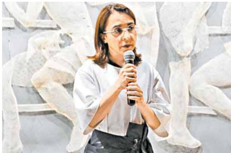
Пришли даже к директору известного музея PERMM Наиле Аллахвердиевой