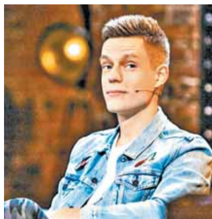
Юрий Дудь* решил больше не ставить плашку иноагента

При нарушении запрета иноагенту грозит штраф: 50 тыс. руб. для физлиц и 500 тыс. руб. для юрлиц. После двух административных нарушений иноагента могут привлечь к уголовной ответственности. Размер штрафа для рекламодателей составляет 300 тыс. руб. Звучит устрашающе, но правоприменительной практики пока нет. Зато есть первые последствия.