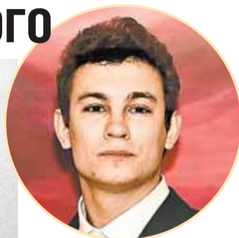
Сходство политика в молодости (слева) и актера – налицо