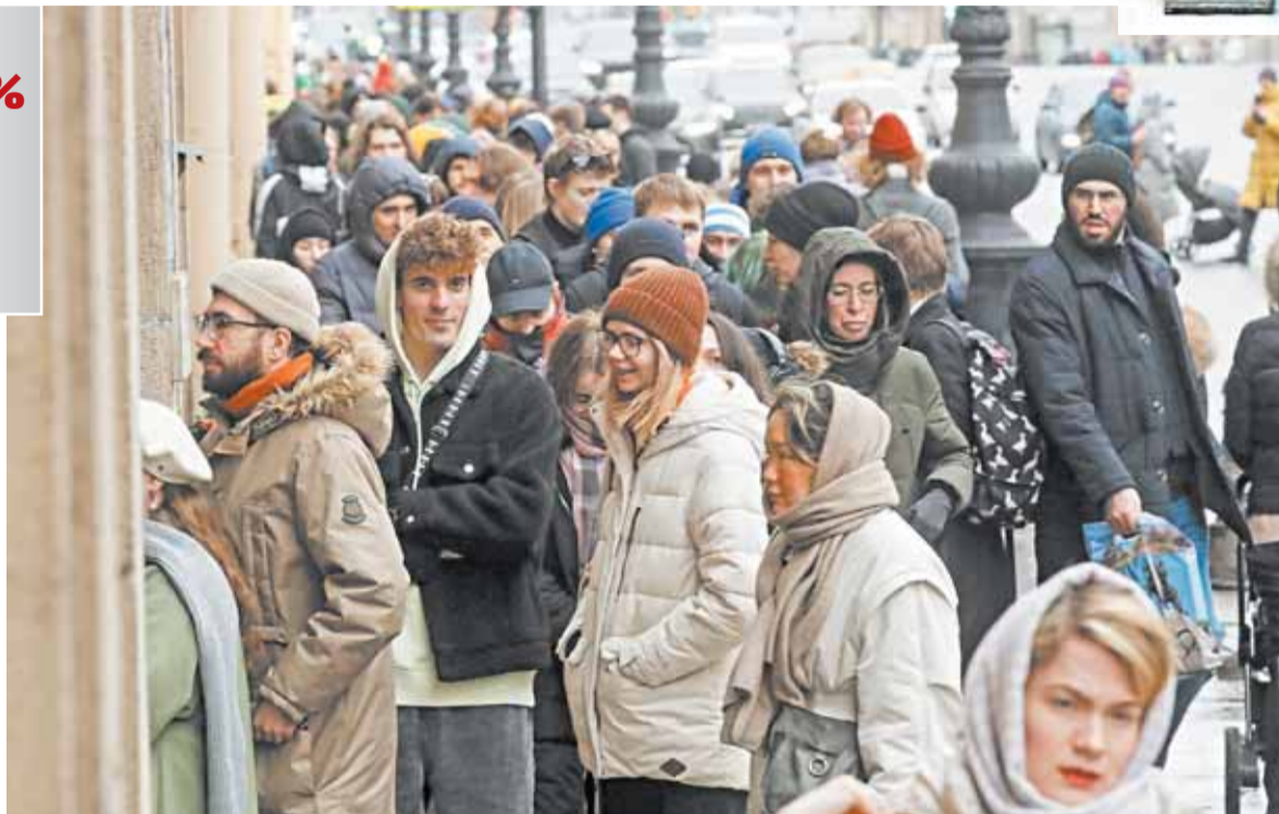
Очередь стала главной формой выражения несогласия с происходящим

Множество подобных инцидентов произошло в первый день трехдневного голосования. Не менее десятка урн оказались залитыми зеленой или краской. В московском районе Марьино пожилая женщина подошла будку для голосования – для этого у бабушки был с собой бензин. Похожие случаи произошли в Симферополе,