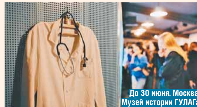
До 30 июня. Москва, Музей истории ГУЛАГа