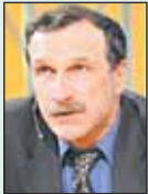
ГЕОРГИЙ БОВТ, политолог