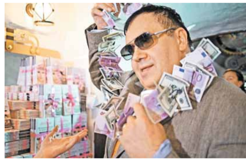
«Мои накопления сгорели в банках»

начинающая актриса, изменила ему. Он об этом узнал и повесился. Причем в крови не было обнаружено алкоголя или каких-то запрещенных препаратов. До сих пор сложно поверить в эту нелепую смерть. Такой красивый парень был, закончил ВГИК, в кино работал... К сожалению, я не смог приехать на похороны, был на гастролях. Больно это вспоминать.