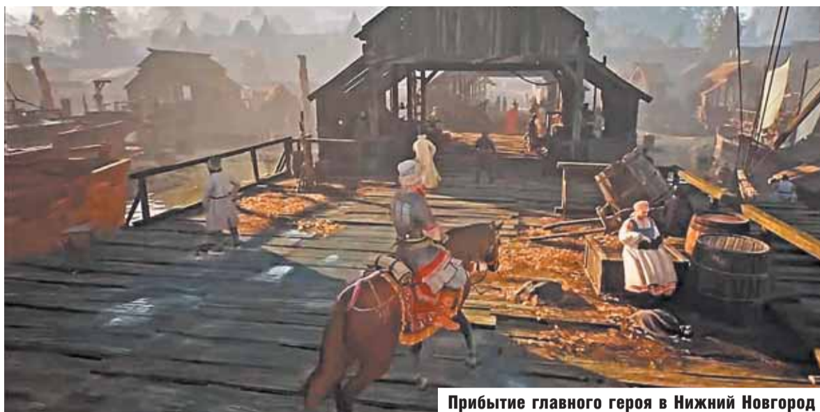
Прибытие главного героя в Нижний Новгород

Все мы переживаем из-за оказавшейся ненадежной дамбы в Орске, в которую вложили почти миллиард бюджетных рублей. А между тем в вышедшую накануне прорыва дамбы РПГ «Смута», разработанную новосибирской студией Cyberia Nova при поддержке Института развития интернета (ИРИ), угрохано, как утверждают в самом ИРИ, около 490 миллионов рублей. Суммарный объем инвестиций в «Смуту» может составить порядка миллиарда. Однако, как и с дамбой, вышло не очень.