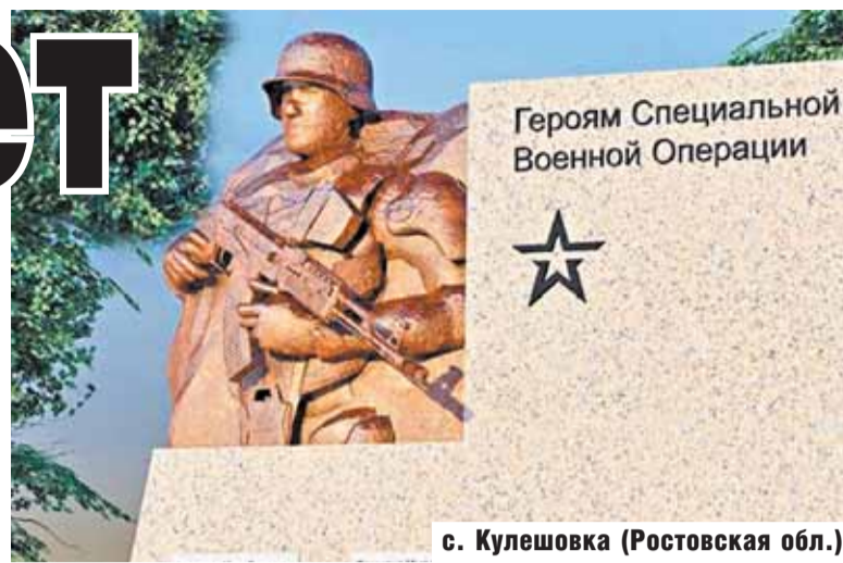
с. Кулешовка (Ростовская обл.)

что восстановление монумента рабочим не в приоритете – это «вопрос 2025-го, а может, и 2026 года», а сейчас важно создать мемориал участникам боевых действий на Украине.