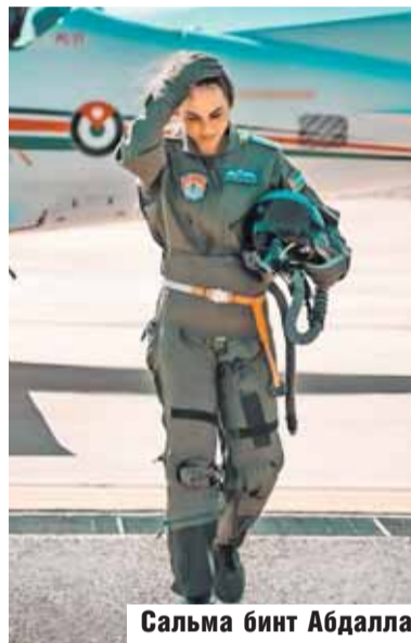
Сальма бинт Абдалла

После иранской атаки на Израиль в ночь с 13 на 14 апреля по миру разнеслась новость, что иорданская принцесса Сальма сбивла шесть беспилотников, пролетавших над территорией королевства. Одни посчитали, что никаких надежных доказательств боевой деятельности представительницы хашимитской династии не было обнаружено, другие воздали должное первой военной летчице в истории страны.