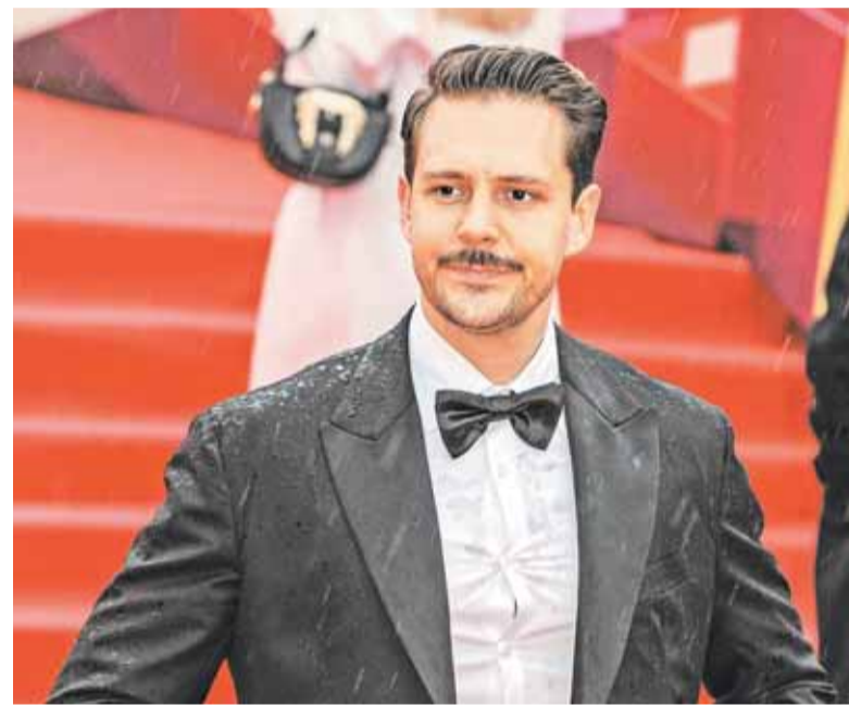
Милош Бикович сыграл в антивоенном фильме

Когда время заставляет читать между строк, Московский кинофестиваль, несмотря на всю бесогонскую пену, остается площадкой, где пока еще