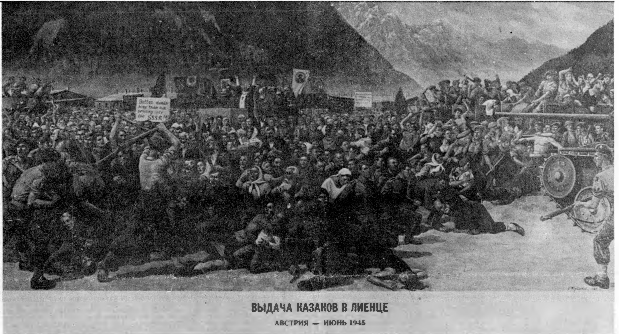
ВЫДАЧА КАЗАКОВ В ЛИЕНЦЕ АВСТРИЯ — ИЮНЬ 1945

Материалы о выдаче казаков в Лиенце читайте на 3 стр.