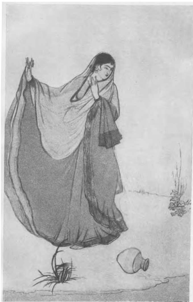
Обониндронатх Тагор. Зов флейты