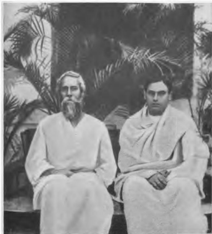
Р. Тагор с сыном (1910 г.)