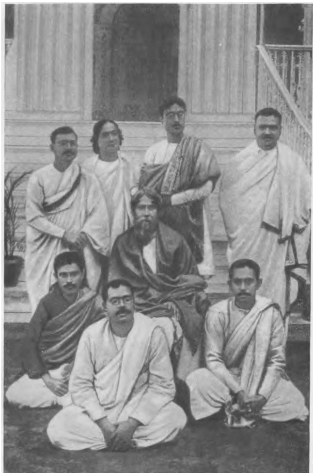
Р. Тагор в кругу писателей перед отъездом в Англию (1912 г.)