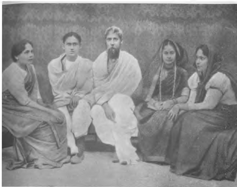
Р. Тагор с семьей (1909 г.)