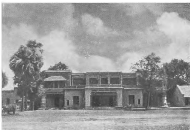
Шантиникетон. Центральная библиотека