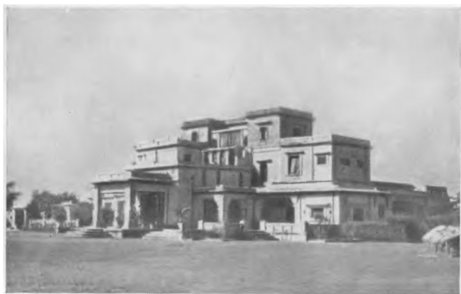
Шантиникетон. «Удаяна» — дом-музей