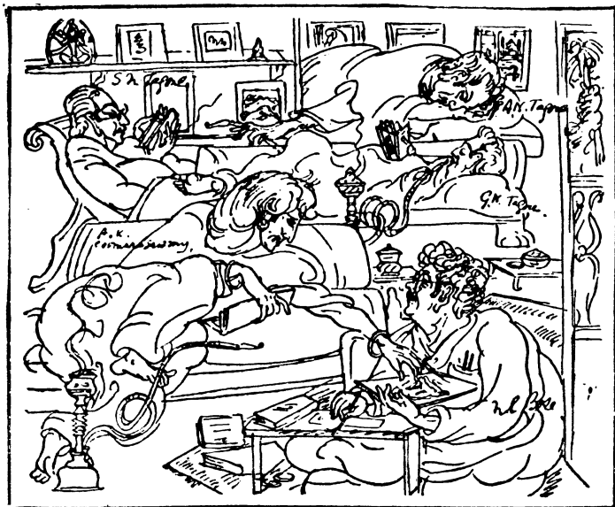
В студии Обонидронатха Тагора — рисунок художника Нондолала Бошу.