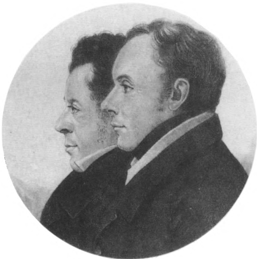
Александр Тургенев и Василий Жуковский