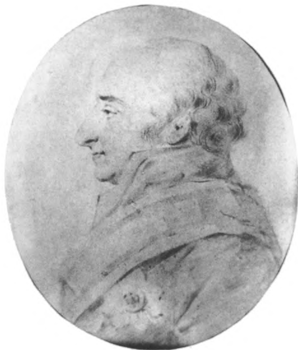
Генрих фон Штейн Рисунок С. С. Уварова