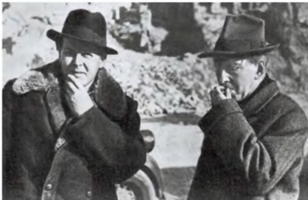
Александр Твардовский и Илья Эренбург (справа). Варшава. 1947 г.