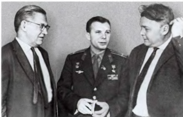
Александр Твардовский (с права) и Алексей Сурков с Юрием Гагариным. 1961 г.