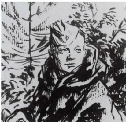
Василий Тёркин. Рисунок О. Верейского