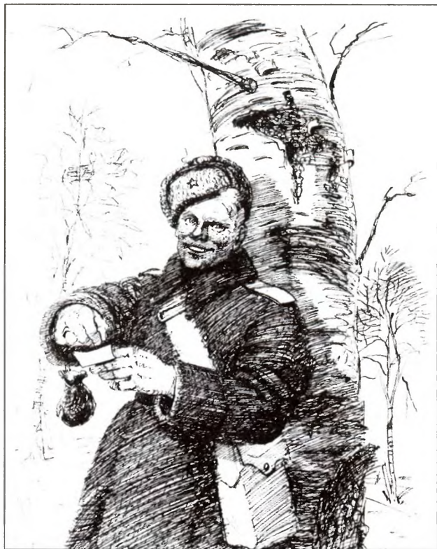
Василий Тёркин. Рисунок художника А. Каневского