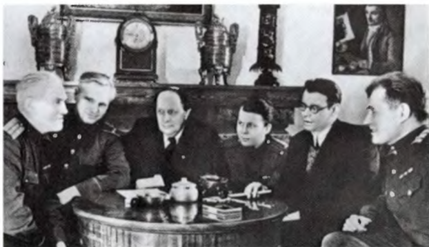
В гостях у Алексея Толстого: Н. Тихонов, С. Шипачёв, А. Толстой, А. Твардовский, М. Исаковский, А. Сурков. Май 1944 г.