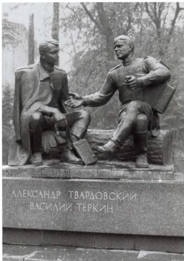
Александр Твардовский и Василий Тёркин в бронзе. Скульптурная композиция А. Г. Сергеева. Смоленск. 1995 г.