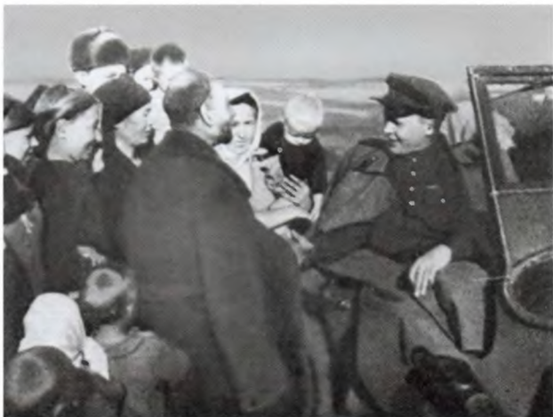
Встреча с земляками в дни освобождения Загорья. Сентябрь 1943 г.