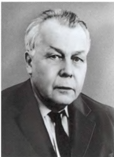
Александр Твардовский. 1970 г.