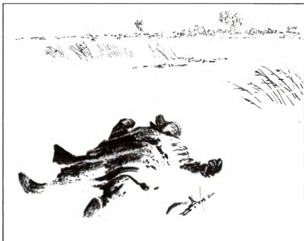
Иллюстрация к главе «Смерть и Воин» из «Книги про бойца». Рисунок художника О. Верейского

Фронтное письмо-треугольник — из множества приходящих автору «Василия Тёркина»