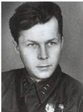
Во время войны. 1942 г.