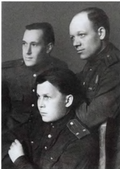
Александр Твардовский с художником Орестом Верейским (слева) и поэтом Василием Готовым, послужившим прототипом Тёркина для рисунка Верейского. 1944 г.