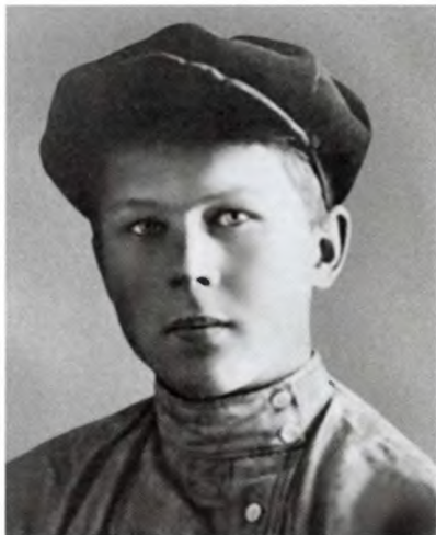
Александр Твардовский. 1927 г.