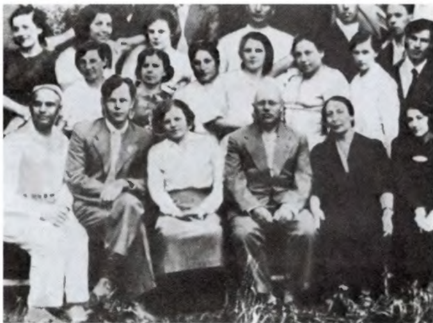
Твардовский (сидит второй слева) с преподавателями и студентами первого выпуска МИФЛИ. 1939 г.