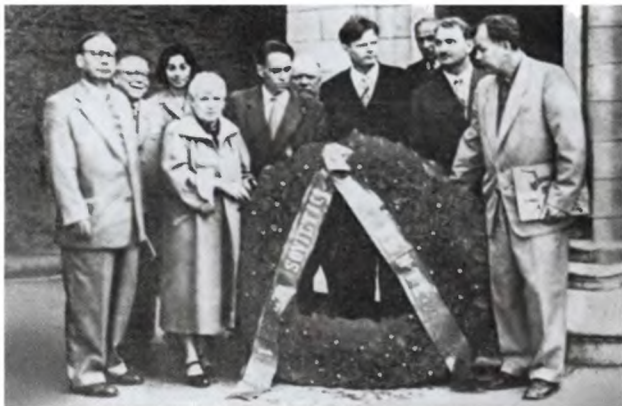
Советские поэты в Италии. При возложении венка на могилу Данте: Н. Заболоцкий, В. Инбер, С. Смирнов, А. Прокофьев, Л. Мартынов, Б. Слуцкий, А. Твардовский. 1957 г.