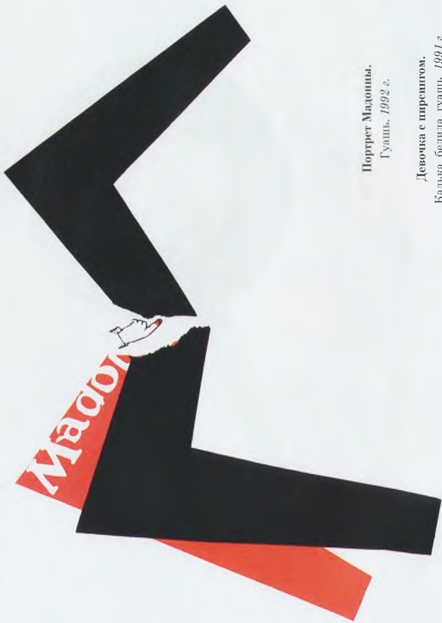
Портрет Мадонны. Гуашь. 1992 г.