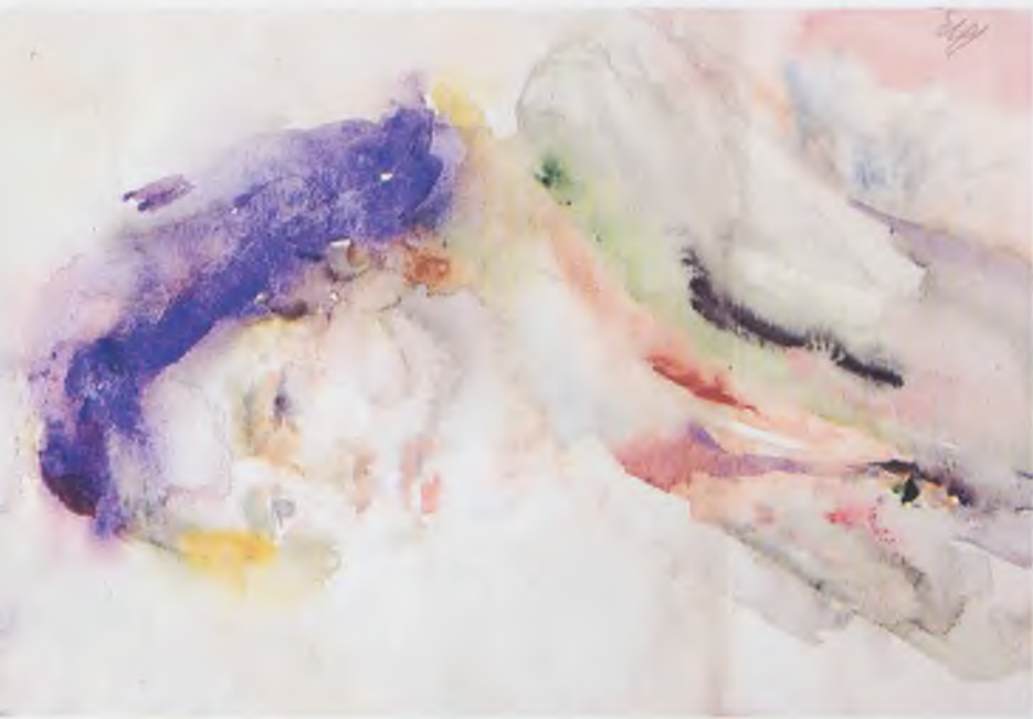
Портрет дамы. Акварель. 1960 г.