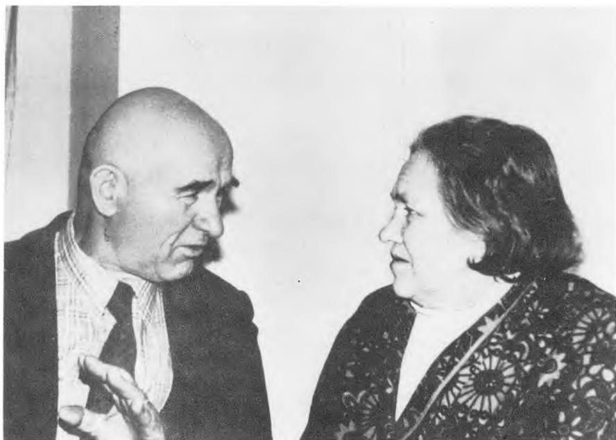
П.Г.Григоренко в больнице у Софьи Васильевны перед отъездом в США. 1977 г.